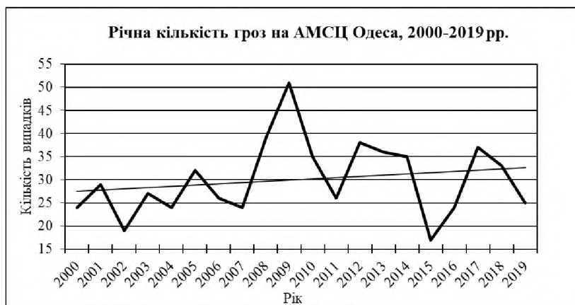
Рисунок 1 – Річний розподіл кількості гроз в Одесі за період 2000-2019 рр.