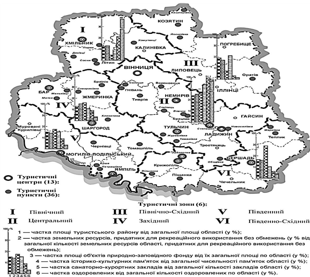
Рис.2.1. Функціонано-територіальна структура ТРК і її елементи[14]

галуззю економіки є не тільки туризм (останній становить лише від 5 до 15 % доходів). На підставі цієї типології територій з точки зору інтенсивності туристично-рекреаційної діяльності та щільності об'єктів туристського показу та інфраструктури туризму в Вінницькій області найбільший інтерес викликають території таких туристських зон (рис.2.1) .