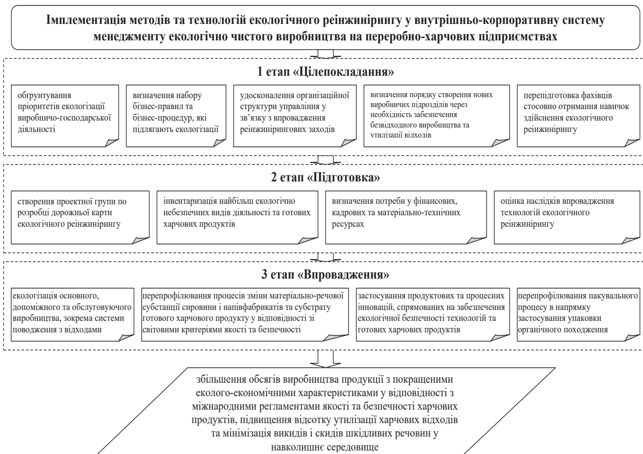
Рис. 3. Порядок імплементації екологічного реінжинірингу у внутрішньо-корпоративну систему менеджменту екологічно чистого виробництва на переробно-харчових підприємствах

ти послідовність та взаємоузгодженість між цілями застосування реінжинірингових заходів та їх реальним втіленням через належну підготовку та впровадження (рис. 3).