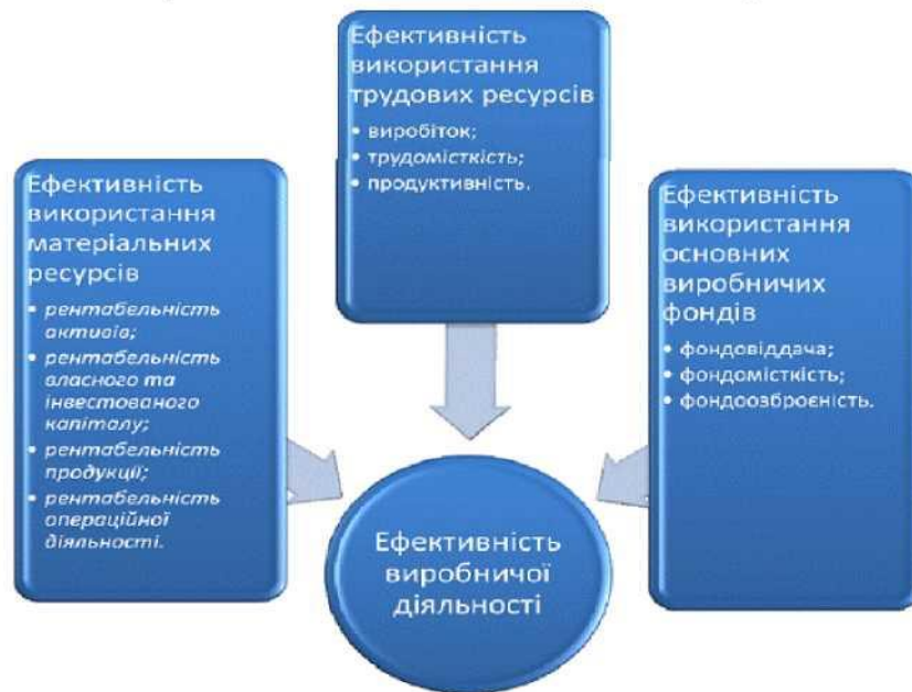
Рис. 1.1. Складові оцінки ефективності виробничої діяльності підприємства

На наш погляд, більш об'єктивний результат з оцінки ефективності виробничої діяльності можна отримати шляхом використання методу економіко-математичного моделювання. А саме, розробивши модель кореляційно-регресійного аналізу. Пропонуємо використати функцію кореляційно-регресійного аналізу в якості показника оцінки ефективності виробничої діяльності підприємства, а також обчислити всі показники, що впливають на функцію.