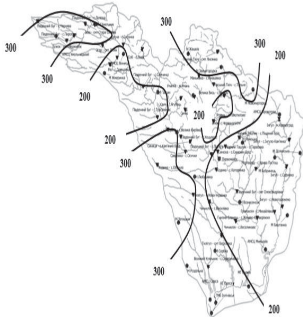
Рис.2. Розподіл по території тривалості схилового припливу тало-дощових вод в басейні Південного Бугу та річок межиріччя Дністра і Південного Бугу ( f_L = 0, f_B = 0 ), год

Значення коефіцієнтів впливу залісеності k'_L і заболоченості k'_B на середньобагаторічні величини тривалості схилового припливу, що одержуються з карто-схеми їх розподілу по території визначаються за рівняннями: