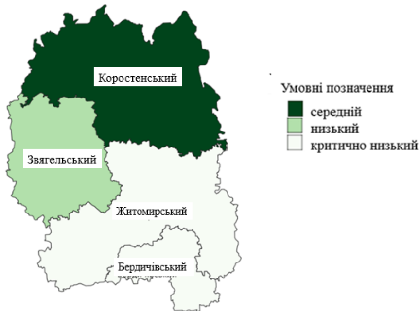
Рис. 3. Територіальний розподіл відсотка заповідності об'єктів природно-заповідного фонду Житомирської області (станом на 01.01.2023 р.)