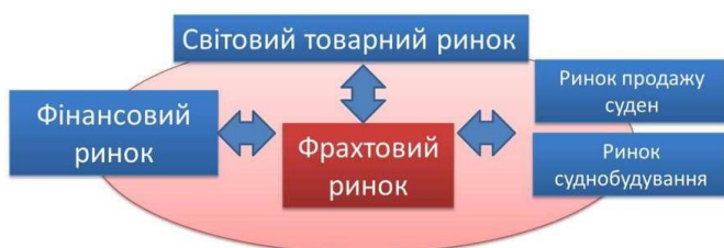
Рисунок 1 – Взаємозв'язок фрахтового ринку з іншими ринками (розроблено авторами)

З початком широкомасштабного вторгнення росії в Україну інфраструктура водного транспорту зазнала великих руйнувань та жертв з боку населення, як наслідок зруйнована економічна система. Для компаній, що працюють у сфері морських перевезень, в якості засобів виробництва виступають судна, сукупність яких формує флот компаній. Експлуатація морських суден може бути продовжена за допомогою їх модернізації. Відзначимо, що вік суден значно впливає на ефективність морських перевезень, а в деяких випадках і на саму можливість надання послуг перевезення. Так, правилами багатьох розвинених країн заборонено захід у порти суден, чий вік перевищує певний рівень. Тому навіть при наявному попиту на перевезення та його ціну, яка задовольняє судновласника, необхідність суднозаходу в порти із зазначеними вимогами змушує судновласника відмовитися від роботи. Пов'язано це з посиленими тенденціями забезпечення безпеки судноплавства не тільки на національному, а й на світовому рівнях. Отже, фрахтовий ринок, ринок продажу суден і суднобудування є тісно взаємопов'язаними ринками (рис. 1).