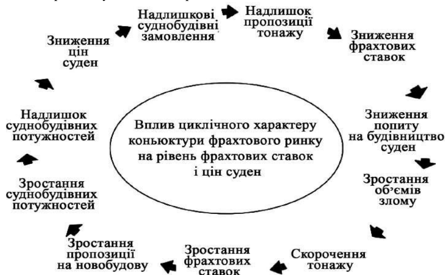
Рисунок 2 – Циклічність фрахтового ринку та її вплив на будівництво суден (розроблено авторами)