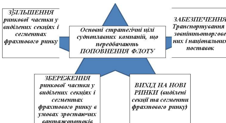
Рисунок 3 – Основні стратегічні цілі судноплавних компаній, що передбачають поповнення флоту (розроблено авторами)

Як відомо, у будь-якого підприємства виокремлюють такі види діяльності – інвестиційна, операційна та фінансова. Тому проєкти поповнення флоту пов'язані із здійсненням інвестиційної та операційної діяльності судноплавних компаній. Варіанти поповнення флоту та їх місце в системі діяльності судноплавної компанії подано на рис. 3.