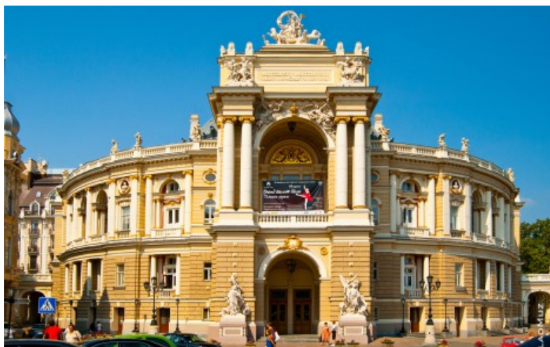
Одеський академічний театр опери та балету