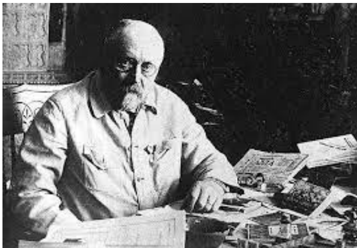
Академік Данило Заболотний