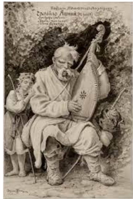
Кобзар – народний співець