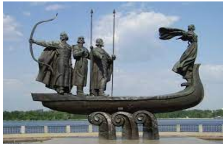
Пам'ятник засновникам Києва