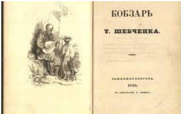
Обкладинка першого видання збірки «Кобзар»

Подивіться на наведені нижче малюнки. Як ви думаєте, чому збірка віршів Шевченка називається «Кобзар»?