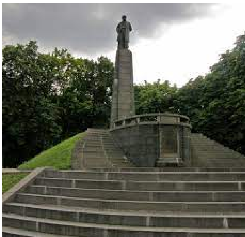
Могила Т.Г. Шевченка

Поховали поета над Дніпром у місті Каневі.