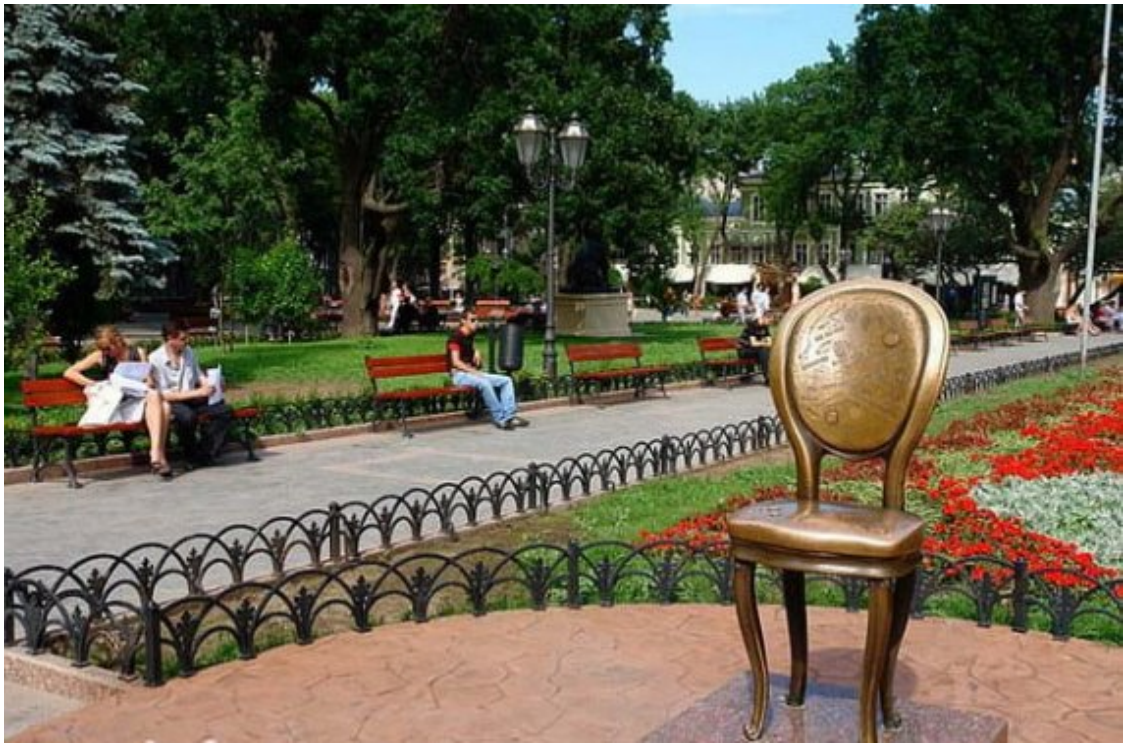
Дерибасівська. Міський сад