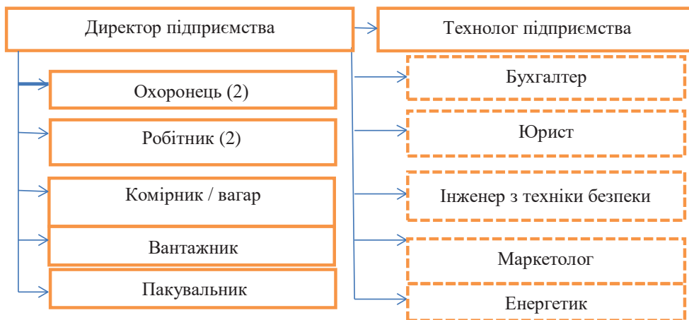
Рис. 1. Організаційна структура персоналу підприємства з виробництва продукції

Кваліфікаційні вимоги до членів проєктної команди наведено у таблиці 1.