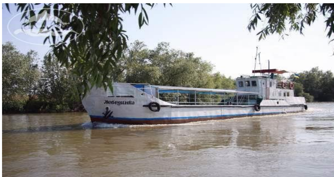
Рис.2.5 Вилкове - поселенням Липованське

Про героїчну історію Ізмаїла свідчить безліч пам'ятників встановлених на честь героїв, які прославили його, як колиску військової слави. В запропонованому маршруті туристи матимуть змогу ознайомитися з найбільш значущими із них.