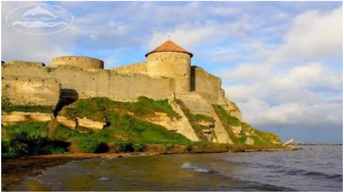
Рис. 2.2 Білгород-Дністровська фортеця "Аккерманська фортеця "

Іншим центром зосередження об'єктів культурно-пізнавального туризму є м. Білгород-Дністровський. Місто засноване більше 2,5 тис. років назад (у VI в. до н.е.), як грецька колонія Тіра.