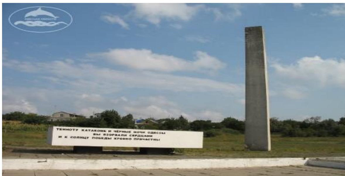
Рис.3.4 Таємниці Одеських катакомб

Одесу. Щоб укріпити оборону чорноморського побережжя, у тому числі і Одеси, 8 липня із складу 9-ї армії була виділена Приморська група. 19 липня її реорганізували в самостійну Окрему Приморську армію, яка стала основною силою оборони Одеси.