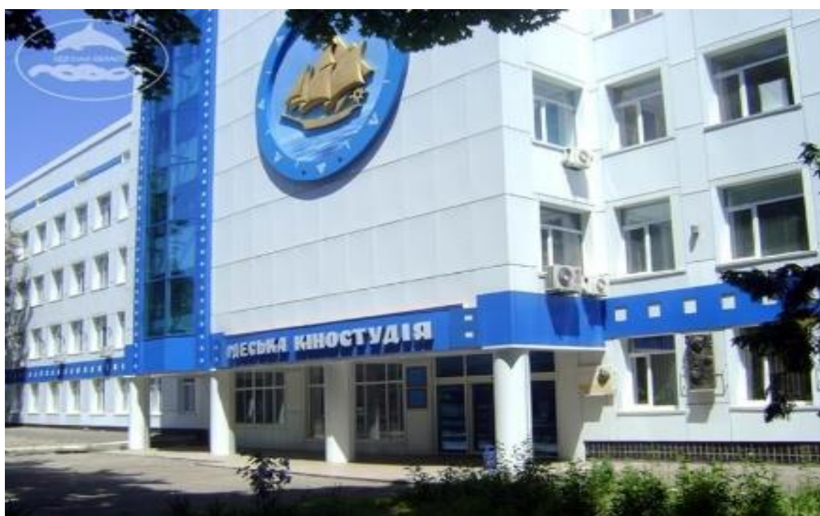
Рис. 3.1 Одеська кіностудія

З перших днів свого існування місто забудовувалося під керівництвом талановитих інженерів і архітекторів. Планування міста стало одним з вищих досягнень містобудування епохи класицизму. Його автор інж. Ф.П. Деволан добре використав топографію місцевості, врахував кліматичні умови, господарський профіль міста і створив виразну в композиційному відношенні планувальну забудову.