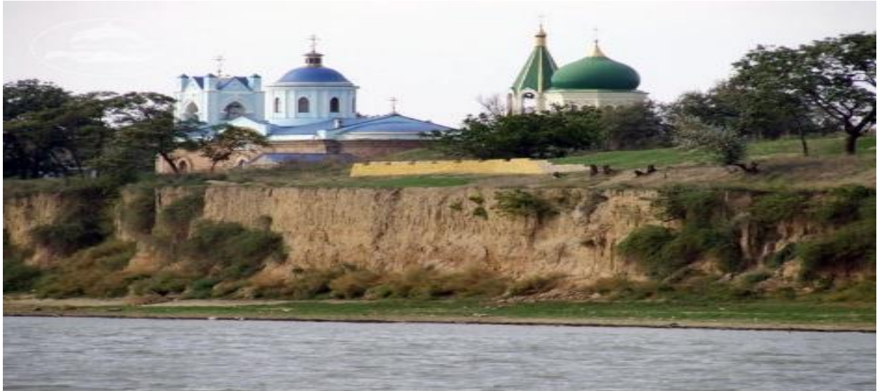
Рис.2.4 Церква Костянтина і Олени, м.Рені

го храму своя історія: колись на цьому місці була невелика церква, в якій, говорять, отримав благословення на штурм фортеці Ізмаїл сам великий полководець Суворов!