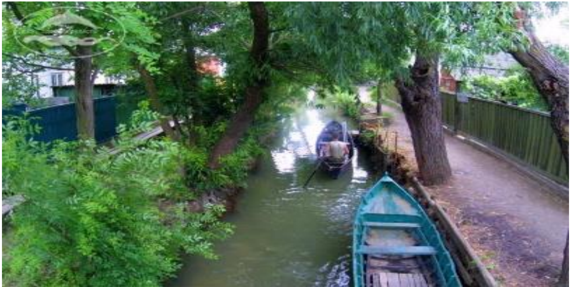
Рис. 2.1 Вилкове - поселення Липованське

Значний культурний і етнографічний інтерес представляють українські і російські поселення нижнього Придунав'я України. Пріоритетне значення тут, поза сумнівом, належить м. Вилкове – поселенню, заснованому в середині XVIII ст. російськими старообрядцями-розкольниками. Іншу частину першопоселенців склали запорізькі козаки, які переселилися сюди після ліквідації Запорізької Січі в 1775 р., щоб уникнути закріпачення і зберегти січові вольності. Старообрядців, що поселилися в дельті Дунаю, раніше називали «Филиповані», по імені одного із засновників тутешньої общини Пилипа Васильєва. З часом перший склад загубився, і вийшло «липовані». Зате церковні обряди свої старовіри зберегли в недоторканності, якими були вони ще до розколу російської церкви в 1654 році. Липовані і зараз складають велику частину населення м. Вилкове.