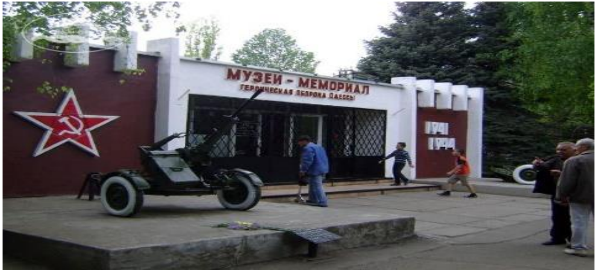
Рис.3.3 Меморіальний пояс Слави

К. Блакитний. Постановку перших вистав театру здійснили відомі режисери: Б. Глаголін, М. Тінський, В. Вільнер, К. Бережний, Є. Коханенко, М. Терещенко, Г. Юра.