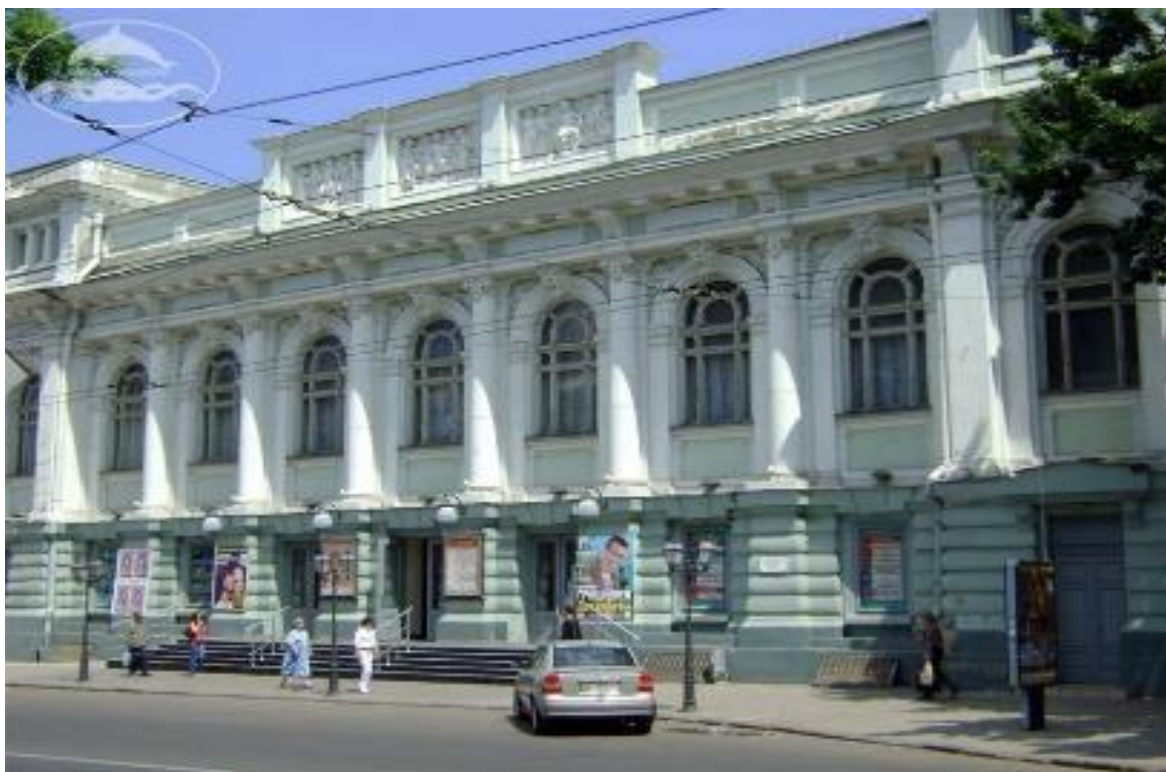
Рис.3.2 Одеський академічний український музично-драматичний театр ім. В.Василька

Туристи, які скористаються цим маршрутом, дізнаються про зіркових акторів, які засяяли на одеських театральних підмостках. Ніяка статистика не підрахує, скільки квітів отримали одеські артисти, скільки захоплення викликали вони в серцях вдячних глядачів.