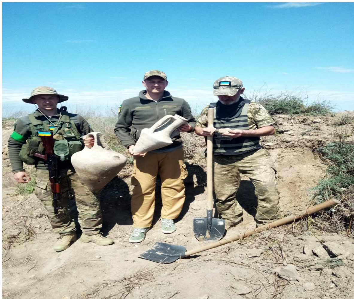
Рис. 1.2 Античні амфори датовані приблизно IV-V століттям до н. е.

"В одному зі структурних підрозділів бригади, під час проведення фортифікаційних робіт, військовослужбовці знайшли стародавні амфори, датовані приблизно IV-V століттям до н. е.",