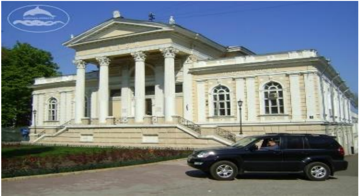
Рис. 1.4. Художній музей