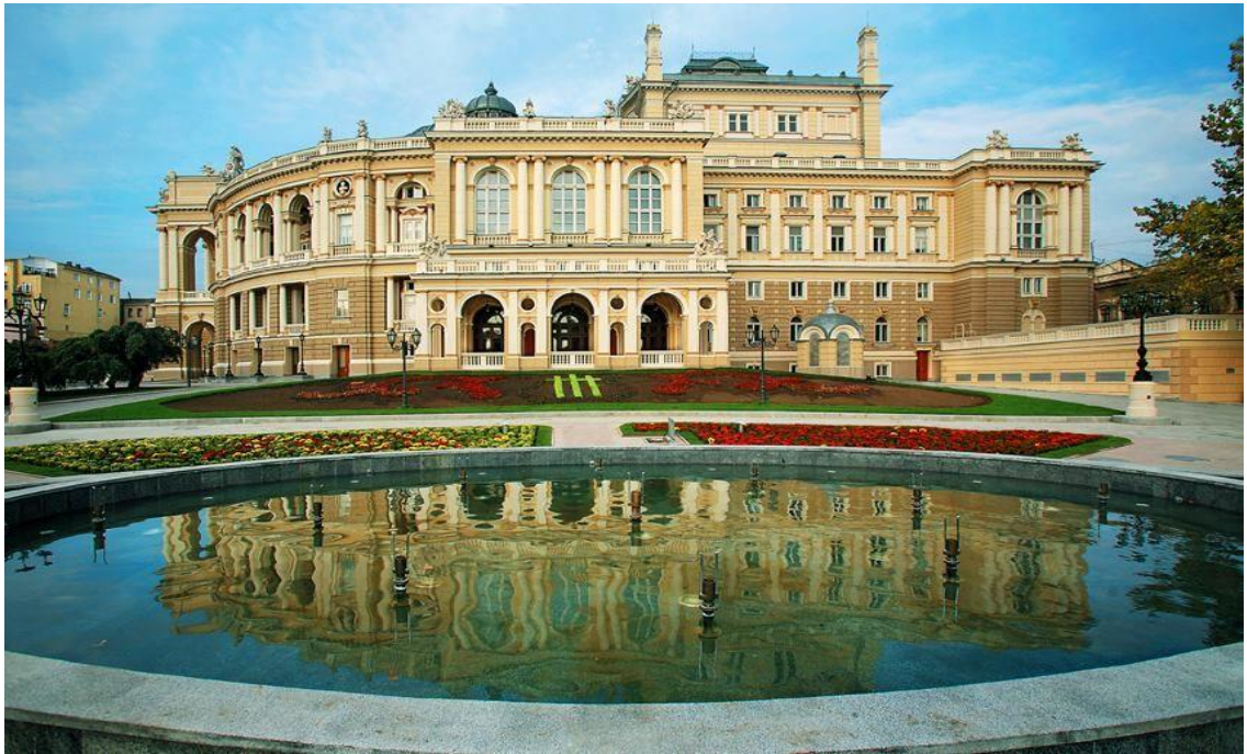
Рис. 1.3 Одеський академічний театр опери та балету

академічний театр опери та балету, Перша Одеська біржа (сьогодні тут розташовується Одеський міськвиконком), Воронцовський палац, пушка, знята з англійського фрегату “Тигр”, Потьомкінські сходи, монумент герцогу де Рішельє, Шахський палац, одеський “Пасаж” тощо.