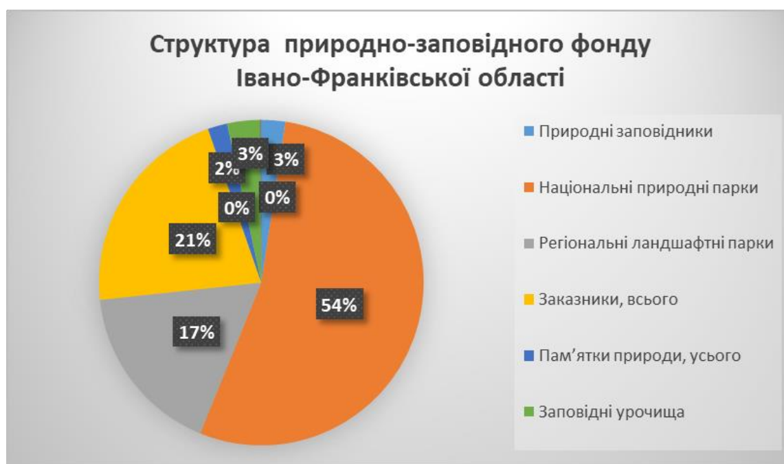
Рисунок 3.1 Структура мережі природно-заповідного фонду Івано-Франківської області в розрізі основних категорій (% від загальної площі ПЗФ)

Структура мережі природно-заповідного фонду Івано-Франківської області в розрізі основних категорій (% від загальної площі ПЗФ) представлена на рисунку 3.1.