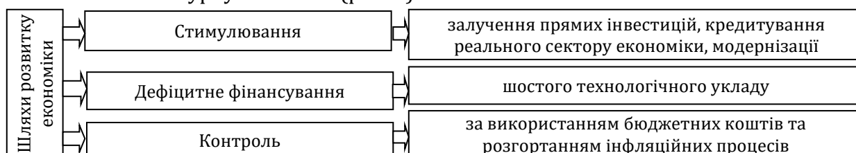
Рис. 3. Шляхи розвитку економіки в умовах глобальної турбулентності

В цілому глобальна турбулентність як негативно, так і позитивно впливає на соціально-економічний розвиток систем. Визначають напрями розвитку економіки в умовах глобальної турбулентності (рис. 3).