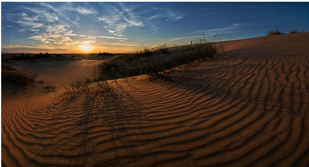
Рис.1.3 Національний природний парк «Олешківські піски»

Також увагу привертає такий об'єкт екотуризму на Херсонщині, як Олешківські піски (рис.1.3), який вважається найбільшим піщаним масивом Європи.