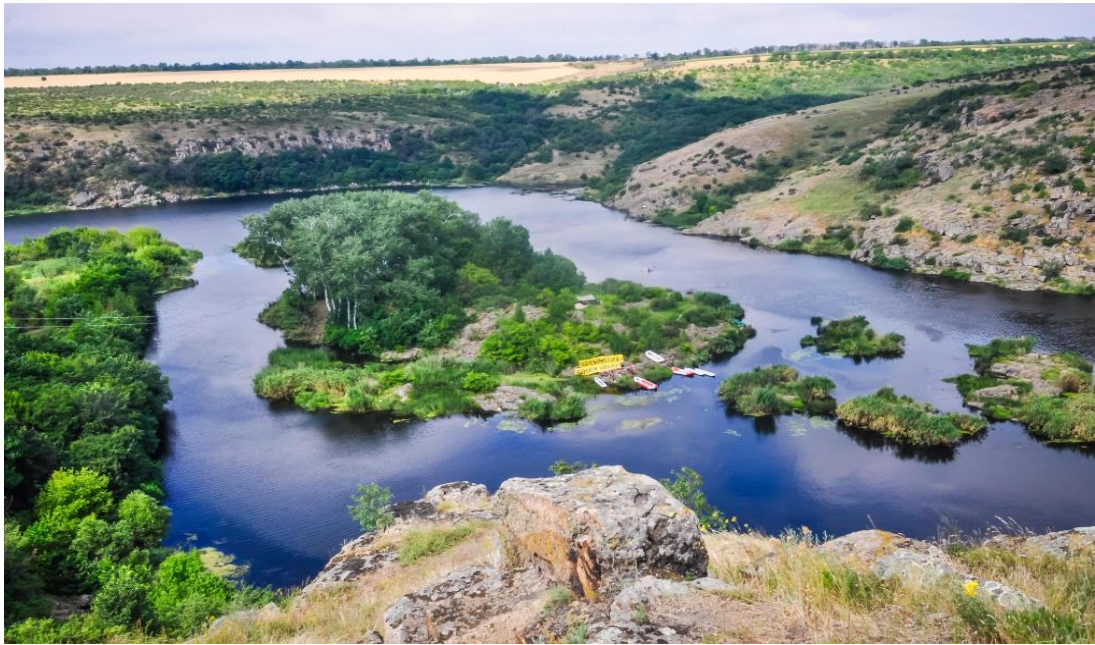
Рис.1.4 Територія Бузького Гарду

В Миколаївській області, у долині р. Південний Буг розташований національний природний парк «Бузький гард» (рис.1.4). Унікальний він тим, природа тут мало змінена людиною, багатий та унікальний видовий склад флори і фауни, а виходи на поверхню гранітів надають рівнинному Бугу виду швидкої і бурхливої гірської річки. До складу національного природного парку входить урочище «Бузький Гард», що є пам'яткою історичного ландшафту Запорізької Січі, першої козацької республіки [18].