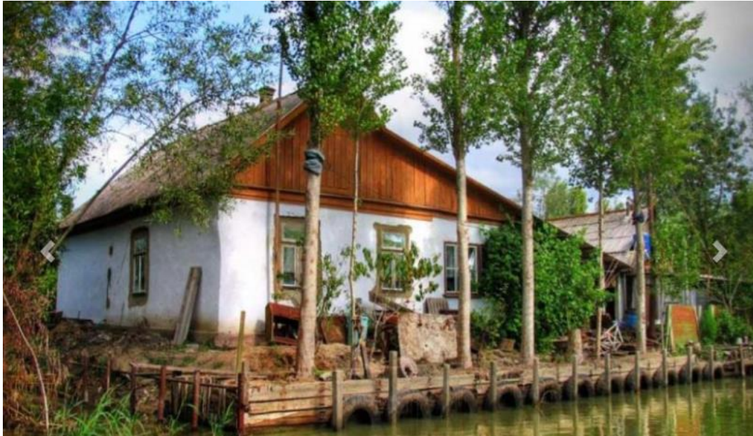
Рис.1.2 «Українська Венеція» - село Вилкове

степову флору. Тут розміщені Український степовий природний заповідник «Єланецький степ», біосферний заповідник «Асканія-Нова».