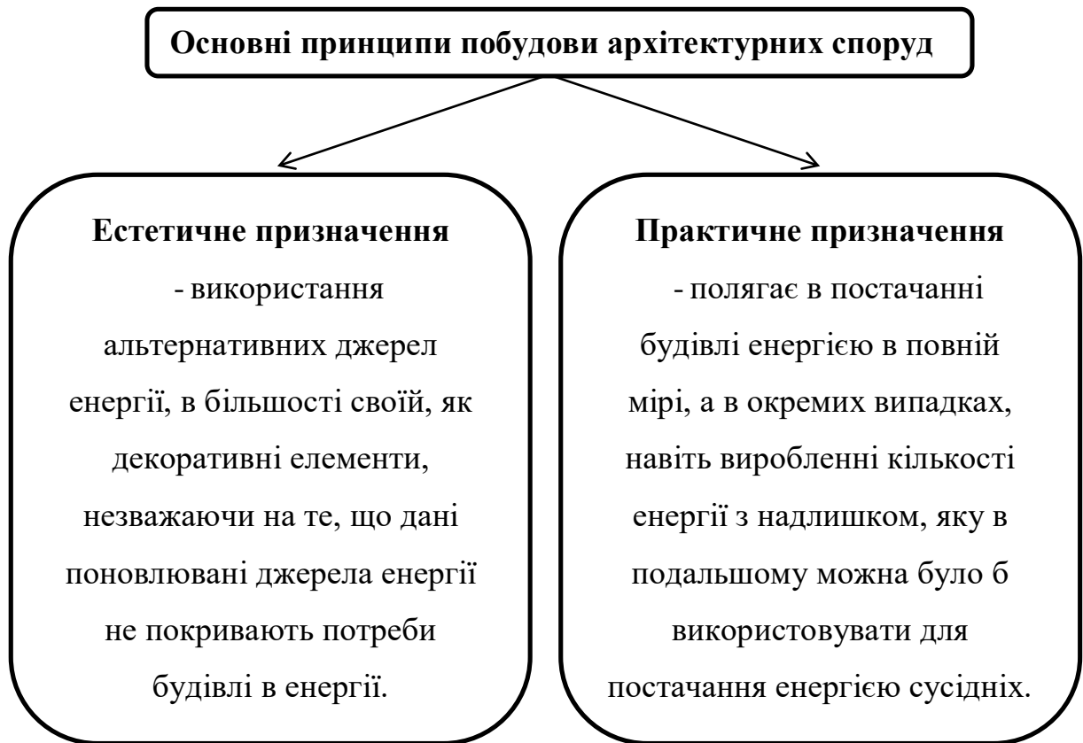
Рис. 1.1. Основні принципи побудови архітектурних споруд

Естетичне призначення передбачає використання альтернативних джерел енергії, як декоративні елементи, але дані поновлювані джерела енергії не покривають потреби будівлі в енергії.