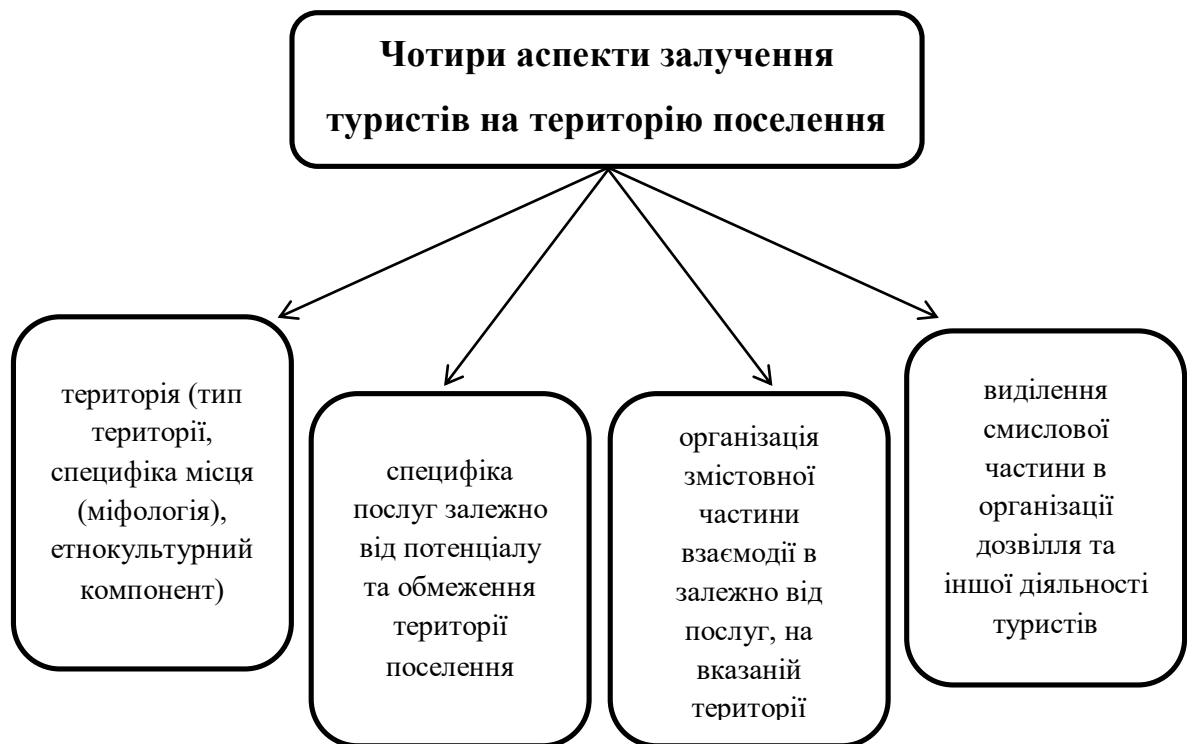
Рис. 2.2. Чотири аспекти залучення туристів на територію поселення.

Залучення туристів у гостьові будинки та фермерські господарства можна не лише рекламною, а й змістовної частини перебування туристів на територіях поселення.