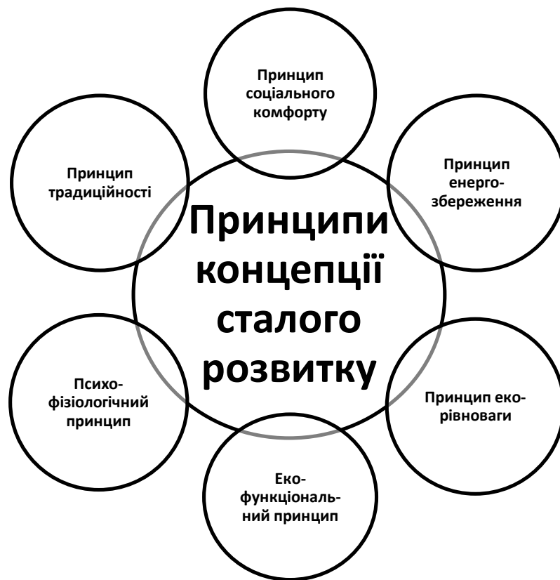
Рис. 1.2. Основні принципи екологічного функціонування і розвитку їх житлового середовища згідно концепції сталого розвитку

Сучасна цивілізація штучно поділяє людину та природу. Людина, яка знаходиться поза природним середовищем, або не розуміє, як нею ефективно користуватися, змушена підкорятися штучній системі забезпечення життя, набагато менш ефективною (рис.1.2.).