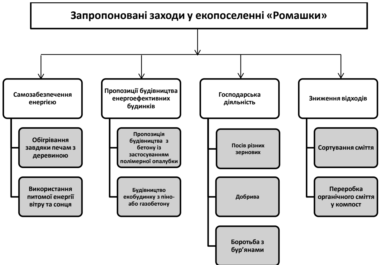
Рис. 3.1. Запропоновані заходи у екопоселенні «Ромашки»

Екологічний населений пункт, будучи функціонуючою інфраструктурою, потребує модернізації спеціалізованого технологічного обладнання для підвищення екологічної ефективності реалізації даної концепції організації населених пунктів.