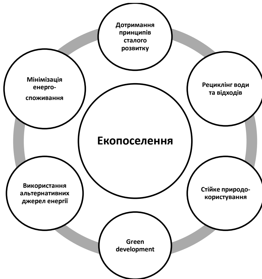
Рис.1.3. Спільні риси екопоселень

Екопоселенням можна вважати альтернативне поселення, створене з метою організації екологічно безпечної життєдіяльності його членів на засадах органічного землеробства.