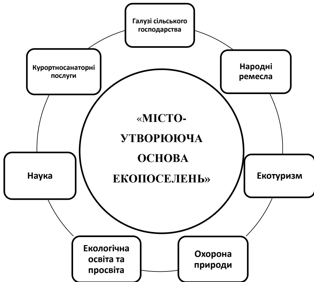
Рис.1.4. Містоутворююча основа екопоселень

Жителі поселення займаються екологічним бізнесом – виробляють сиродавлену олію, цільнозернове борошно, корисну каву з жолудів, печуть печиво, роблять хліб, створюють натуральну косметику, варять мило на рослинній основі, майструють вироби та прикраси, шують із натуральних тканин, створюють гарні (рис.1.4.).