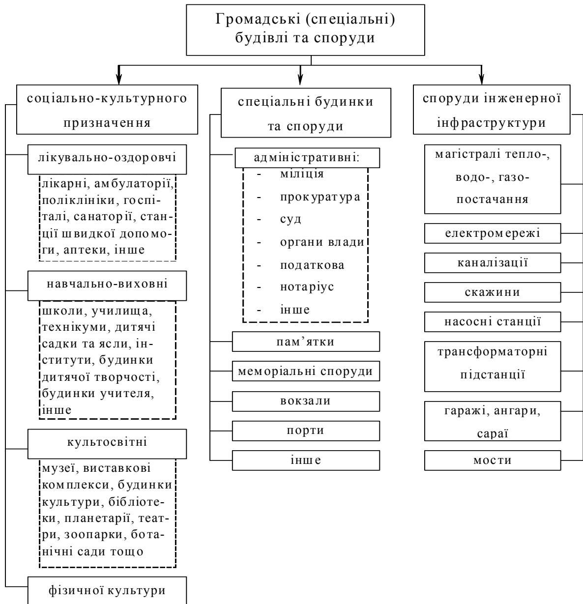
Рисунок 9.2 - Класифікація об'єктів комунальної власності