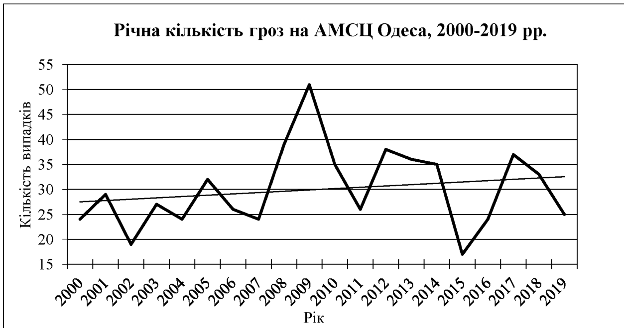
Рис. 1. Річний розподіл гроз на АМСЦ Одеса за період 2000-2019 рр.