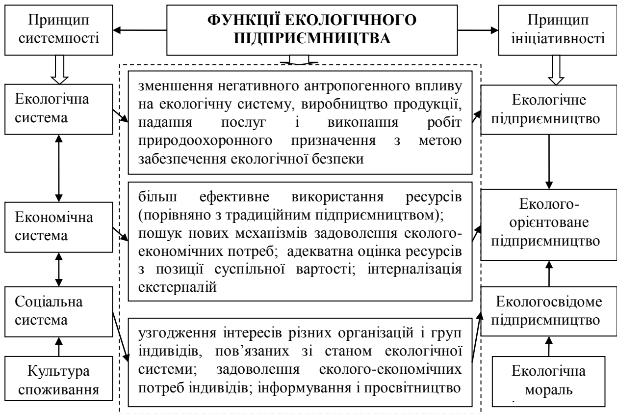
Рис. 1. Функції і термінологічні аспекти екологічного підприємництва

Атрибутами екологічного підприємництва є: домінування частки екологічної корисності в загальній корисності товару; задоволення екологічних потреб (з позиції споживачів); отримання доходу від «реалізації» екологічної корисності (з позиції підприємців); ресурси екологічної системи розглядаються як фактори, що впливають на потреби споживачів [3, с. 173].