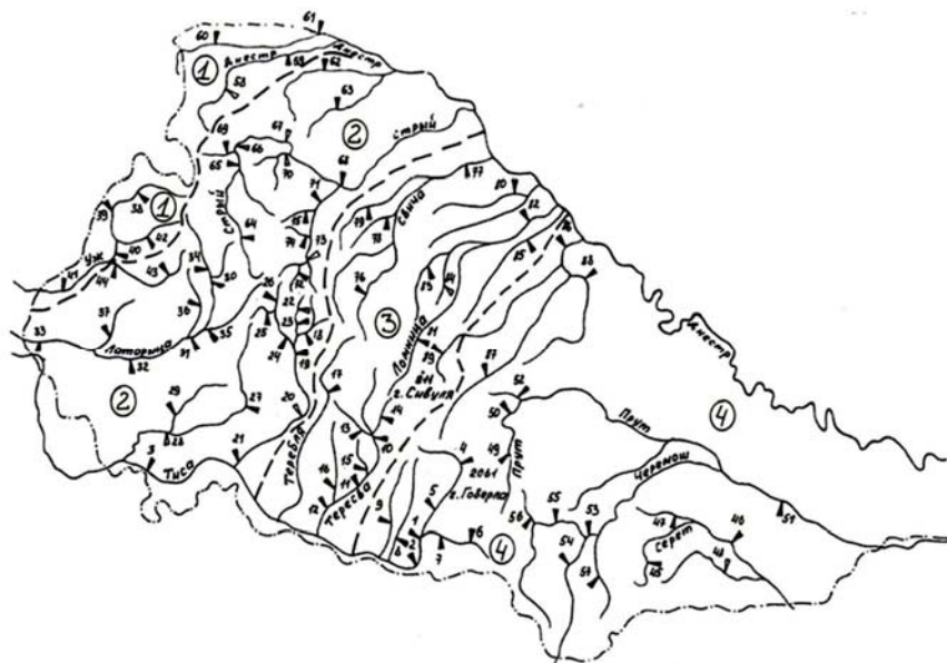
Рис. 1. Карта-схема районів, які виділені по середніх шарах паводкового стоку, приведених до умовної висоти 500 м (гірські річки Українських Карпат) (Гопченко и Джабур Кхалдун, 1999)

У результаті дослідження здійснено просторове узагальнення шарів стоку в гірських районах Українських Карпат. Стокові характеристики в горах, на відміну від рівнинних територій, підпорядковуються не географічній зональності, а висотній поясності. Картування стокових величин, по суті, у гірських умовах неможливе або має певні труднощі. Тому виконане районування (Гопцій, 2016; Гопченко и Джабур Кхалдун, 1999) приведених шарів стоку 1%-ї забезпеченості до умов H_{cp} = 500 м і f_n = 50\% (рис. 1, табл. 1).