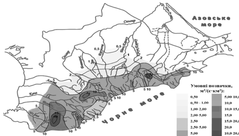
Рис. 3. Розподіл максимальних модулів схилового припливу 1%-ї забезпеченості по території Гірського Криму, \text{м}^3/(\text{с} \cdot \text{км}^2)

Незважаючи на те, що складові схилового припливу ( T_0 та Y_{1\%} ) мають значущі залежності від висоти, їхня результуюча q'_{1\%} суттєво не змінюється зі зростанням висоти місцевості. Проте спостерігається зменшення q'_{1\%} зі збільшенням географічної широти центрів водозборів, що відповідає розподілу опадів на даній території. Це стало підставою для картування максимальних модулів схилового припливу q'_{1\%} паводків теплового періоду на річках Криму (рис. 3).