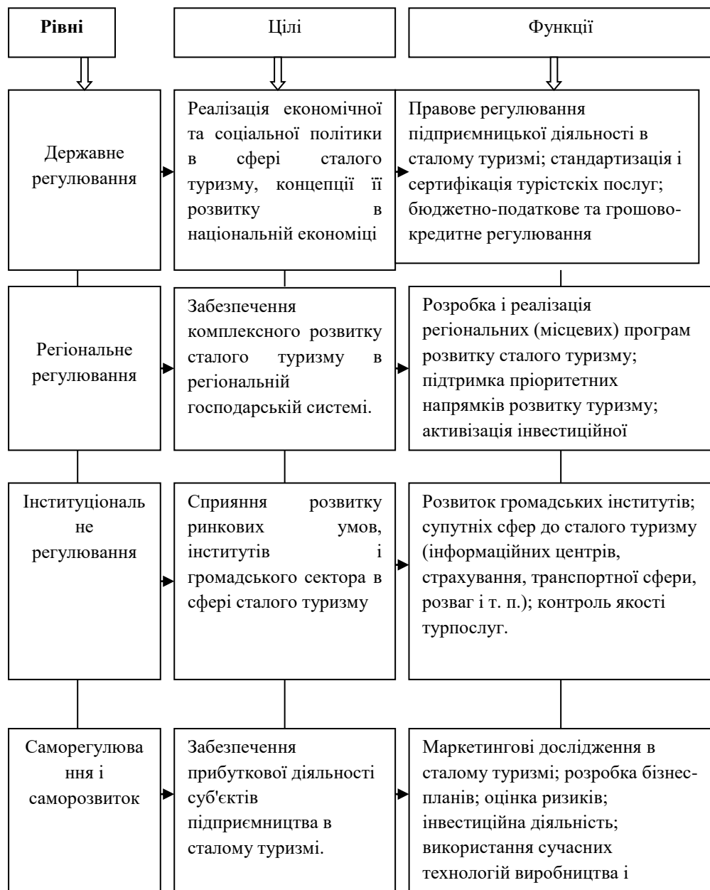
Рис. 4.2 Структура організаційно-економічного механізму створення туристичного кластеру

З огляду на особливості і проблеми в сфері сталого туризму, а також недосконалість підприємницького середовища, ефективним інститутом партнерства всіх зацікавлених суб'єктів має стати створення туристичних кластерів. У найбільш широкому розумінні, кластери є