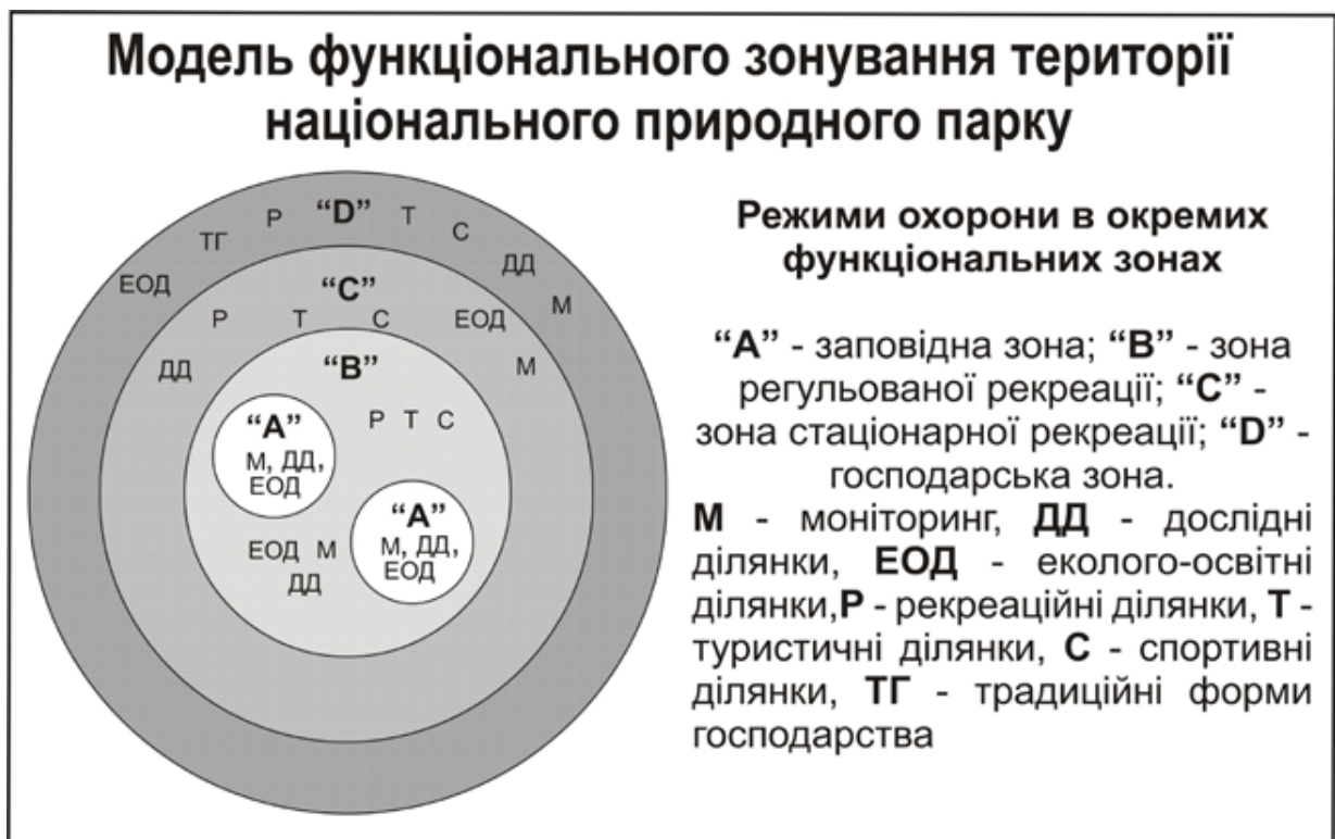
Рис. 2.1 - Ідеальна модель функціонального зонування території НПП

забороняється будь-яка діяльність, яка призводить або може призвести до погіршення стану довкілля та зниження рекреаційної цінності території НПП. Модель функціонального зонування НПП розробляється з урахуванням всіх природних особливостей території а також господарського використання земель. Модель зонування території передбачає виділення чотирьох функціональних зон на основі ролі природних комплексів в збереженні ландшафтного та біологічного різноманіття, а також стійкості екосистем до рекреаційної та туристичної діяльності. При моделювання природних парків слід враховувати, що вони можуть включати як натурні так і господарські екосистеми. Ідеальною є модель НПП в центрі якого знаходиться заповідна зона навколо якої розміщені зона регульованої рекреації та зона стаціонарної рекреації, що відіграють роль буферних територій і «пом'якшують» вплив господарської діяльності на заповідну зону. Господарську зону раціонально винести на околиці парку (рис. 2.1) [14,19].