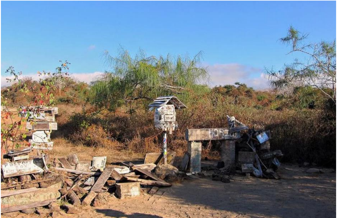
Рис.3.7. Флореана Post Office Bay

Десятиліттями пізніше, неофіційний поштовий офіс Флореани все ще діє - чому б не залишити свою листівку або перевірити, чи можете ви взяти одну для когось з вашого рідного міста?! Крім цієї чарівної традиції, Затока Поштового Офісу має приємний пляж, а також короткий туристичний маршрут до печери, яка насправді є лавовим тунелем, що тягнеться до моря.