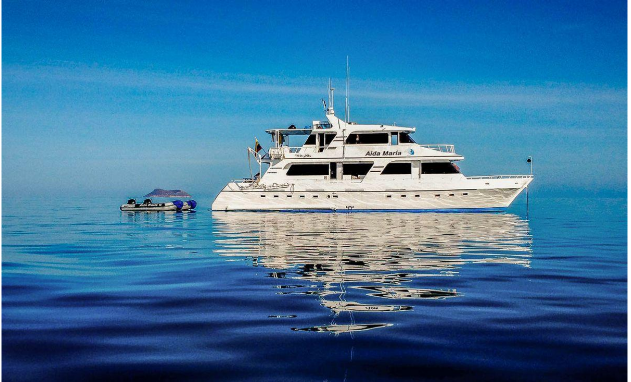
Рис.3.4.Судно Aida Maria

та стильного досвіду. Вона має 8 двомісних кают з традиційними двоярусними ліжками. Каюти прикрашені світлою та просторою обстановкою, у кожній з них є власна ванна кімната з душем, кондиціонер та класичні ілюміновані вікна.