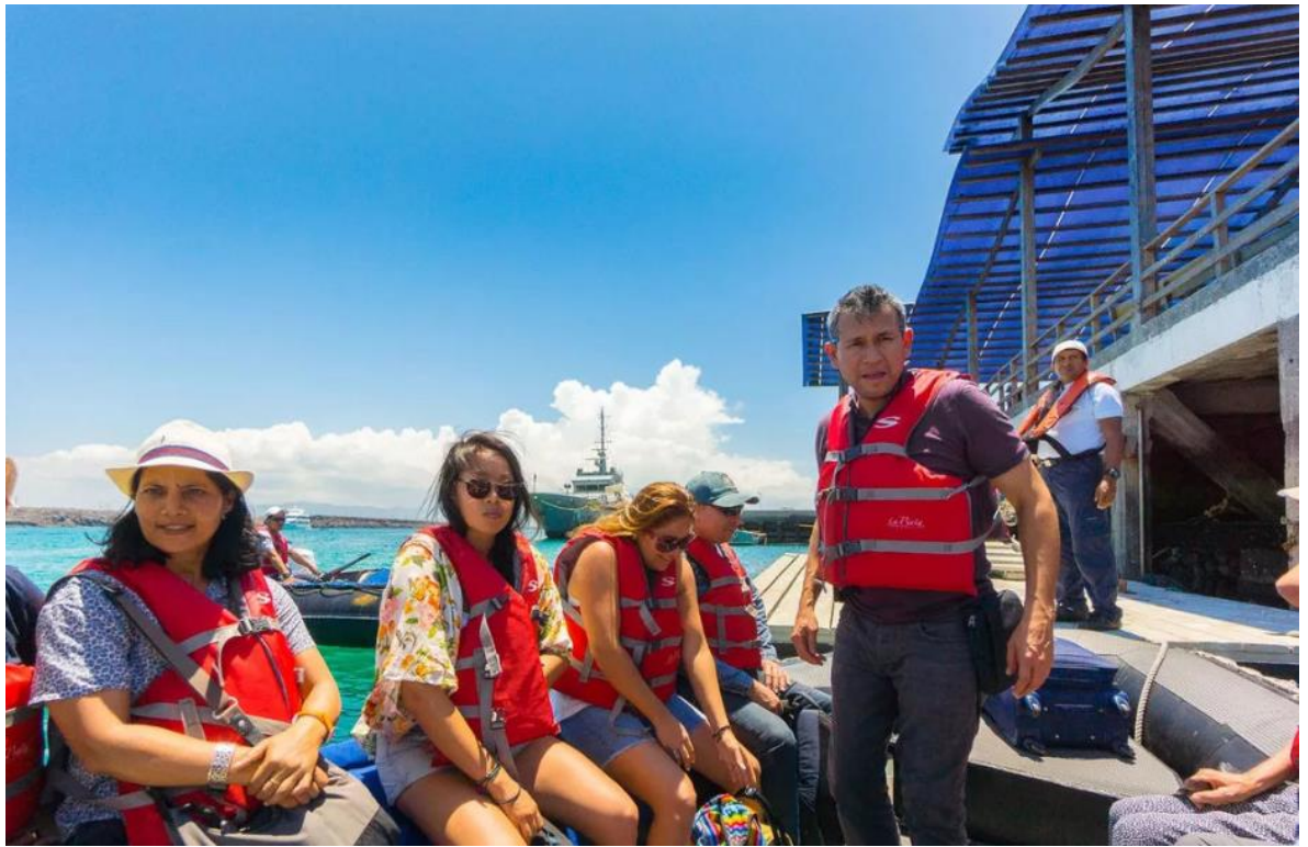
Рис.3.8 Трансфер до аеропорту

На жаль, настав час здійснити дуже коротку поїздку до аеропорту для вашого рейсу назад на материк Еквадор. Ваш гід з Galapatours, який супроводжував вас протягом всього вашого пригодницького туру, супроводить вас до зони вильоту, давши вам останню можливість скористатися їх чудовим місцевим досвідом та неперевершеною кваліфікацією.