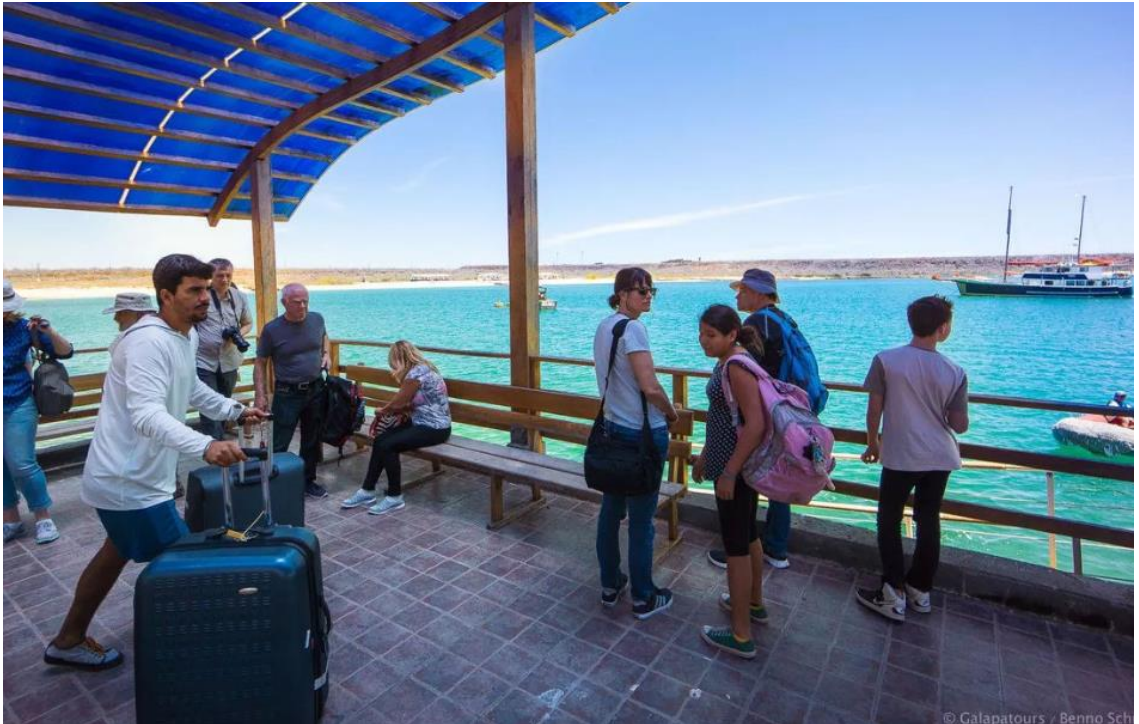
Рис.3.5. Прибуття в аеропорт Балтра

Після посадки вашого рейсу та проходження імміграційних формальностей, вас зустріне наш англомовний гід в залі прибуття, який проведе вас до трансферного транспорту для короткої поїздки до вашого чекаючого судна.