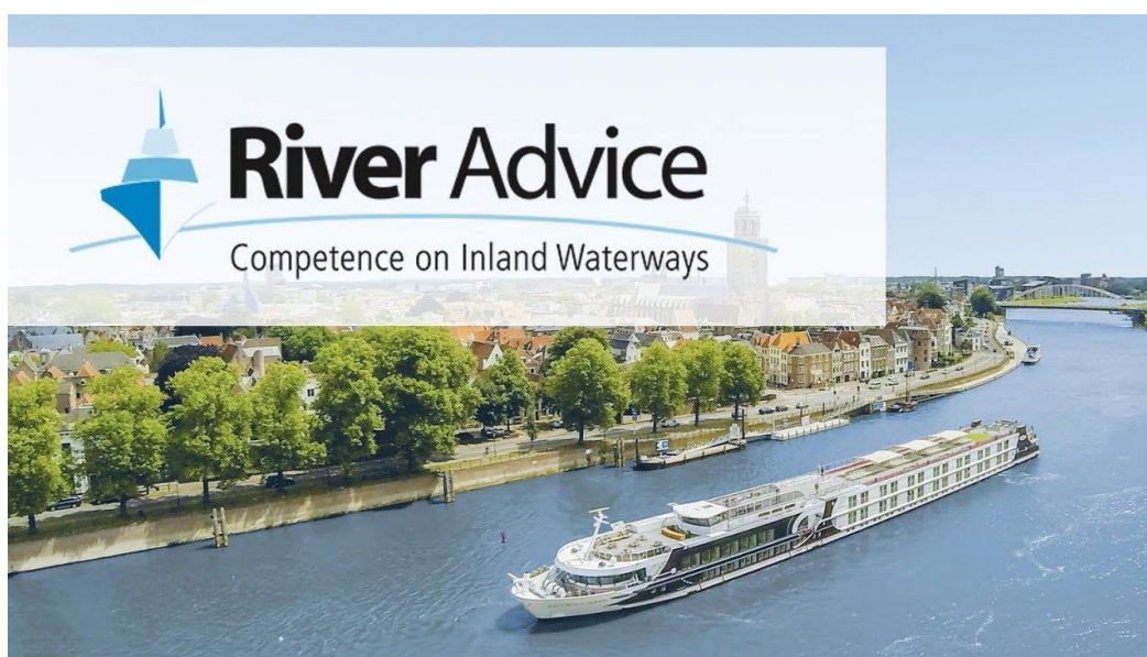
Рис.3.2.Судно компанії River Advice

4. Costa Cruises: Ця компанія пропонує морські круїзи з відвідуванням різних пунктів в Україні, зокрема Одеси та Южного порту. Вона відома своїми розкішними кораблями та багатими розважальними програмами. Проблемою може бути непостійність пасажиропотоку через недостатню популярність круїзів серед українських туристів.