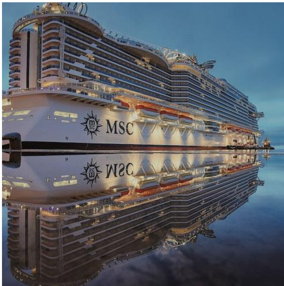
Рис 2.1 Судно компанії MSC Cruises

"MSC Cruises" (рис.2.1) також пропонує круїзи, які охоплюють острови в Тихому океані. Наприклад, їхні маршрути можуть включати острови Фіджі, Вануату та Нову Каледонію. Туристи можуть насолоджуватися білими пляжами, кораловими рифами та екзотичною природою цих місць.