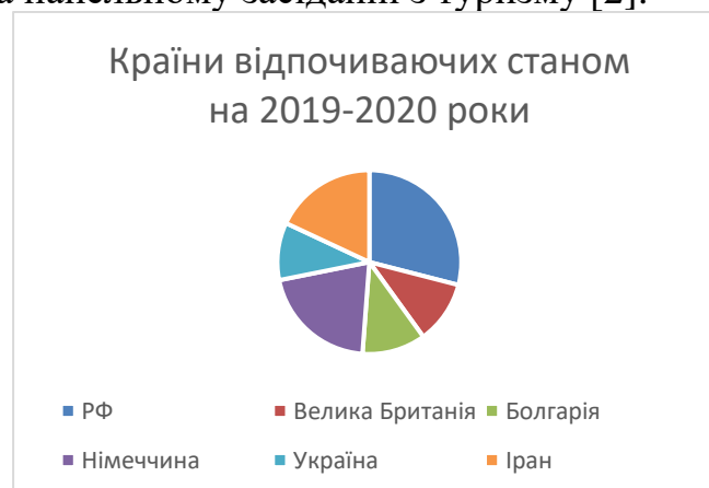
Рис.1 – кількість іноземних туристів в Туреччині

Туризм на сучасному етапі відіграє все помітнішу роль не лише у світовій економіці, а й в економіці окремих країн. Країна, що бажає стати популярним туристичним центром, повинна володіти унікальними природними й культурними комплексами і пропонувати їх на туристичний ринок, а також мати оптимізовану систему природокористування. Саме все це притаманне Туреччині, яка є однією з найпопулярніших туристичних країн Середземноморського басейну [1]. Здавна увагу туристів привертають візантійські, античні та османські пам'ятки історії та культури, м'який клімат Туреччини. Одним із важливих чинників популярності туризму в Туреччині є її географічне положення, так як країна з трьох боків омивається Чорним, Егейським і Середземним морями. Славнозвісний Бодрум – це місто здебільшого відвідують корінні турки, саме тут відпочивають місцеві жителі, їх не цікавить Анталія, Аланія, бо там багато іноземців. Бодрум розташований на південному заході Туреччини, омивається водами Егейського моря. Цікавість туристів здебільшого викликають пляжі Бодрума, але не варто недооцінювати замок Святого Петра, адже вид з нього просто неймовірний. «Але в 2022 році в цьому місті проживає вже 480 тисяч людей. А «ліжкомісність» впала нижче 25%. Ці цифри показують, що на жаль Бодрум втрачає свою туристичну привабливість», – заявив Кокадон виступаючи на панельному засіданні з туризму [2].